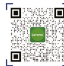
Skaneeri QR kood ja lae alla